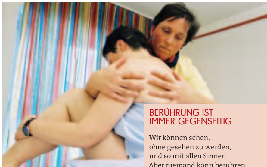
Dem Patienten Obhut und Sicherheit geben

Mir hilft die Erfahrung, dass jeder Patient seinen eigenen Weg geht, und ich freue mich, dass meine Handreichungen hilfreich sein können. Ich sehe