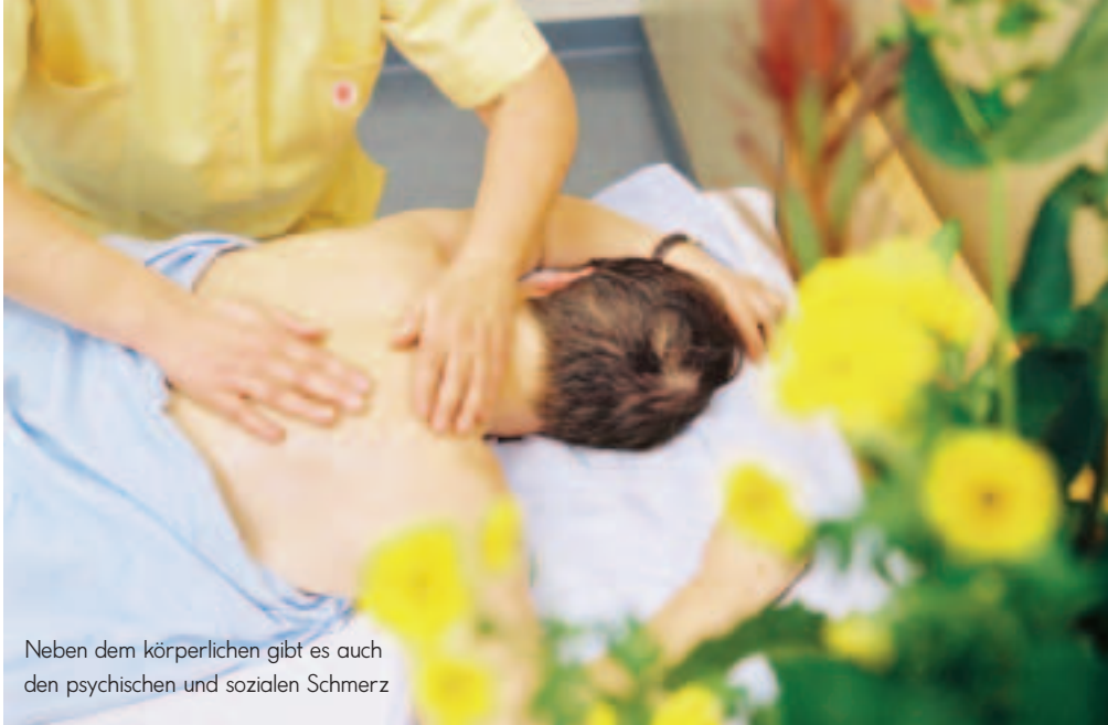
Neben dem körperlichen gibt es auch den psychischen und sozialen Schmerz