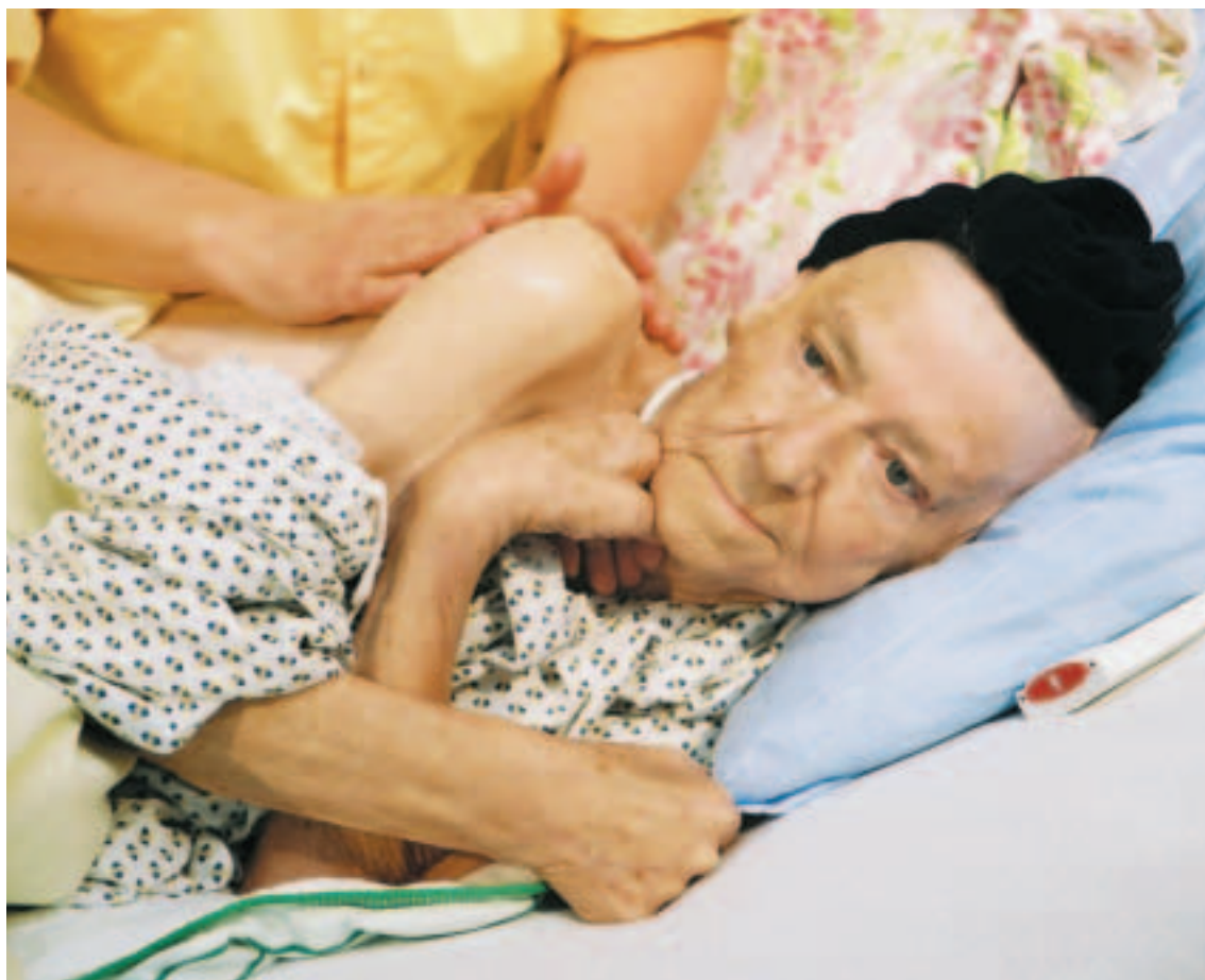
Professionelle Pflege und Hospizarbeit muss im Beziehungsdreieck Patient – Angehörige – Pflegekraft erfolgen