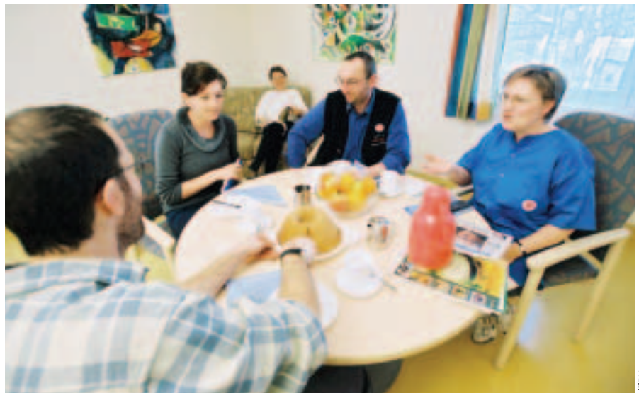
Das Brückenteam ist Schaltstelle für Kommunikations- und Organisationsabläufe

Das Brückenteam bietet Prozessbegleitung und Prozesssteuerung vom Zeitpunkt der Anfrage über Aufnahme und Aufenthalt bis Entlassung/